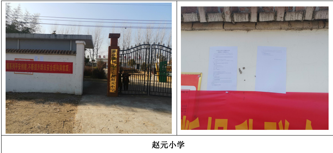
图 3.2-5 环境影响评价公众参与征求意见稿公示张贴