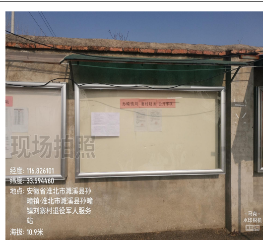
刘寨村党群服务中心