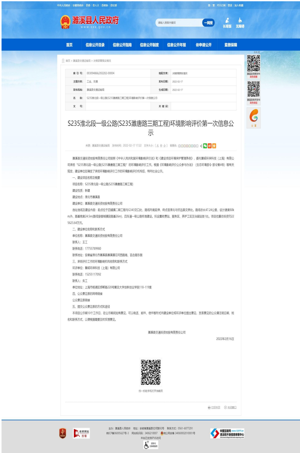
图 2.2-1 濉溪县人民政府网站上环境影响评价首次公示