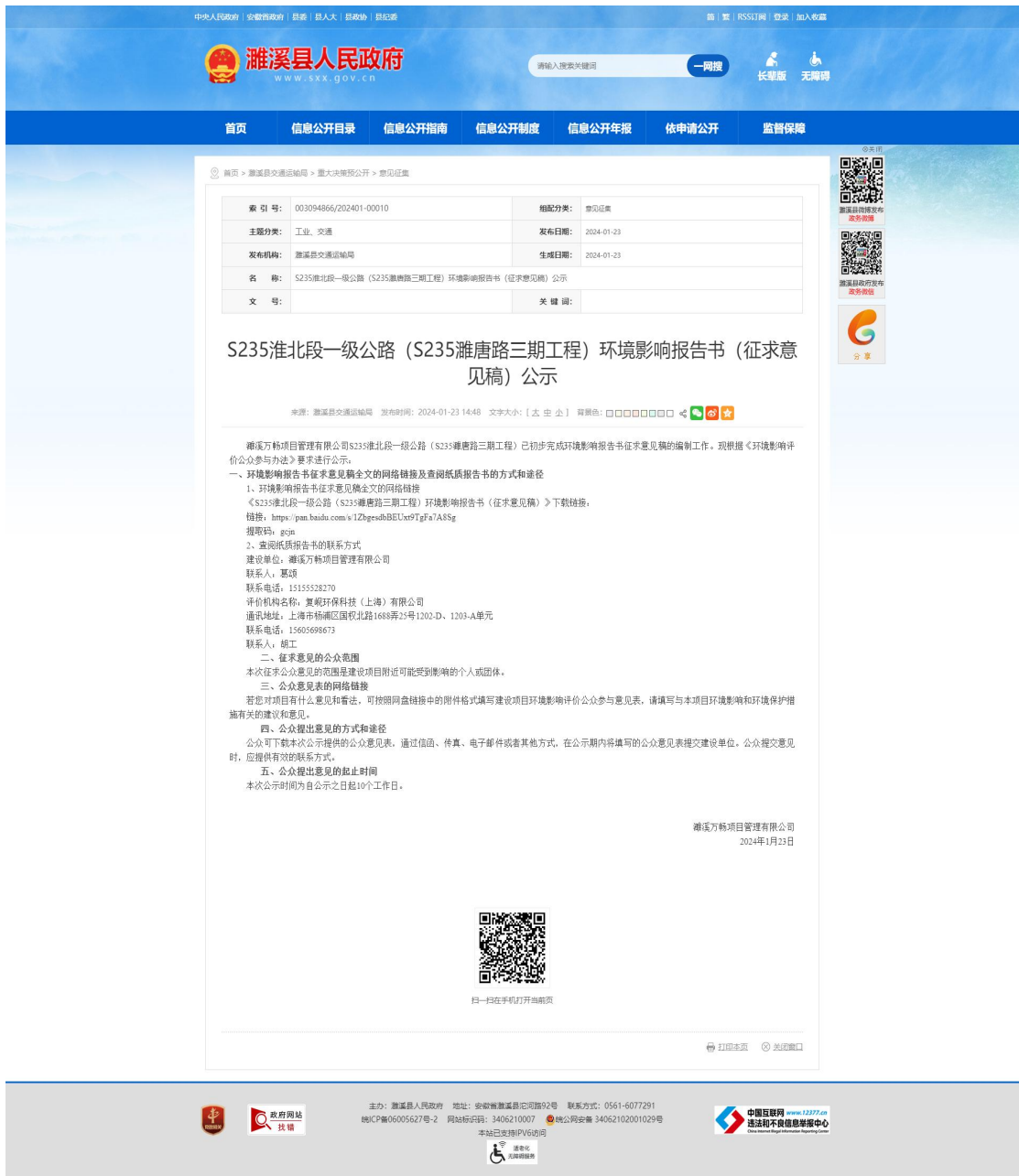
图 3.2-1 环境影响评价公众参与征求意见稿网络公示